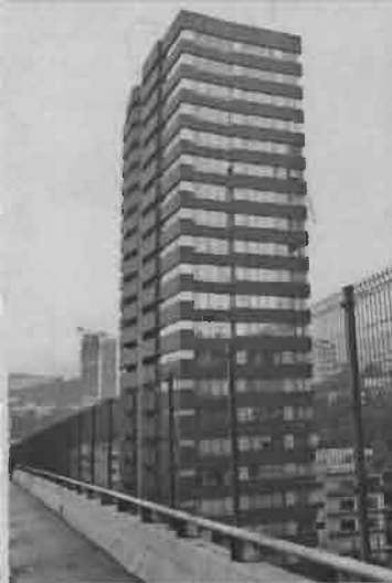
■ En el complejo Torres del Parque, en Bosques de Santa Fe, la PGR ubicó 3 departamentos de Javier Duarte.

El monto del erario lavado por Javier Duarte en inmuebles y joyas supera los 800 millones de pesos, según documentos ministeriales.