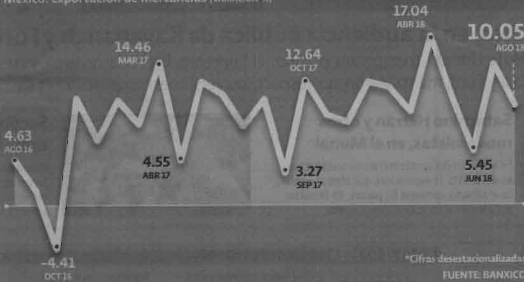
México: exportación de mercancías (VARIACIÓN %)

El gobierno de Trump enviará a su Congreso el aviso de que por ahora sólo tendrá acuerdo con México y, eventualmente, Canadá podría sumarse. En tanto, México registró por 22 meses consecutivos crecimiento en sus exportaciones.