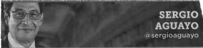
SERGIO AGUAYO @sergioaguayo

El 68 da lecciones sobre la necesidad de transparentar las acciones del Ejército en casos como el de Ayotzinapa.