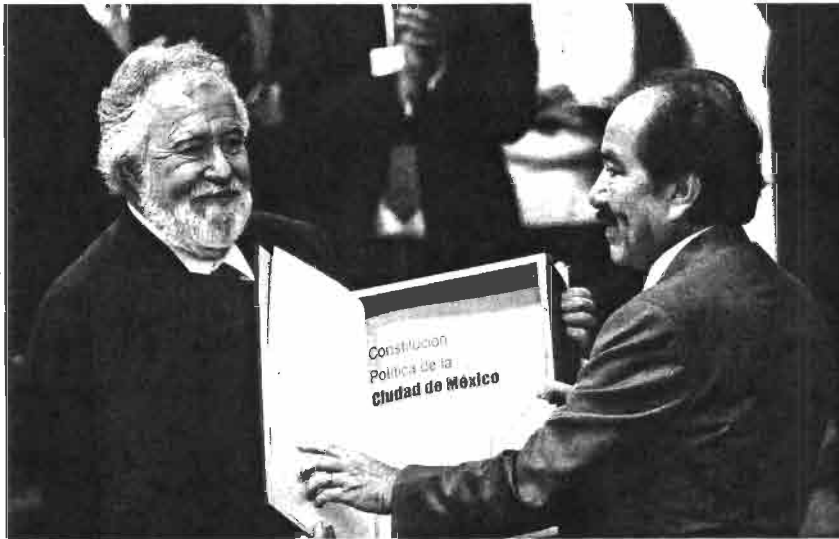
Nueva etapa para la CDMX.