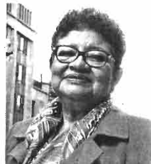
Ernestina Godoy | "Parlamento abierto".