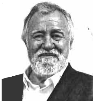
Alejandro Encinas | "Nuevas modalidades gubernamentales".

"Este Congreso capitalino realizará sus funciones legislativas mediante dos periodos ordinarios al año".