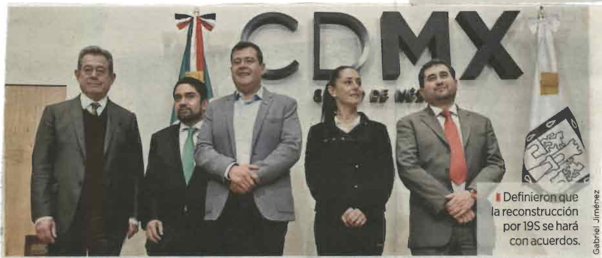
Definieron que la reconstrucción por 19S se hará con acuerdos.

Así como el funcionamiento y operación de la Plataforma CDMX en la que, reconoció Amieva, se debe trabajar permanentemente en aras de dar certeza y llegar a un diagnóstico puntual de los daños para poder atenderlos.