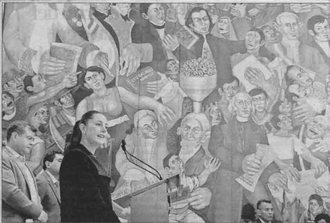
▲ La jefa de Gobierno electa, Claudia Sheinbaum, y el mandatario actual, José Ramón Amieva, se reunieron en privado y posteriormente ofrecieron una conferencia de prensa conjunta.

Sheinbaum manifestó que su gobierno va a respetar los derechos laborales de los trabajadores de base y de nómina 8. "El recorte de plazas que estamos haciendo no tiene nada que ver con los trabajadores de base del gobierno de la ciudad. Estamos hablando de la alta burocracia", precisó.