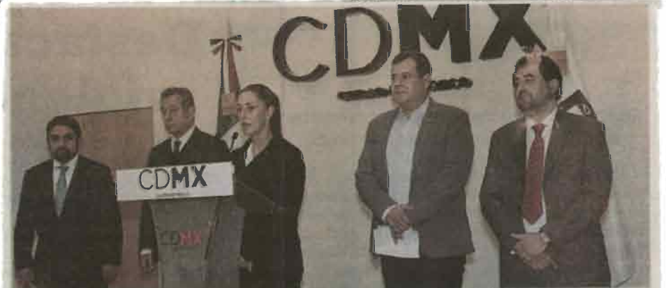
Amieva Gálvez y Sheinbaum Pardo acordaron enviar una iniciativa a la ALDF para redireccionar mil 300 mdp en beneficio de afectados por el sismo.

Dijo "nos interesa, y sobre todo para beneficio de los damnificados, el conocimiento de esta información y en la medida de lo posible y si lo permite el jefe de Gobierno, coadyuvar para tener más información, a partir de que nosotros entremos el 5 de diciembre de este año".