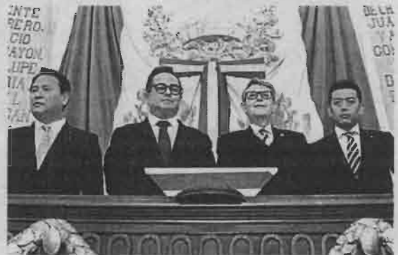
La delegación de Nagoya felicitó a los mexicanos