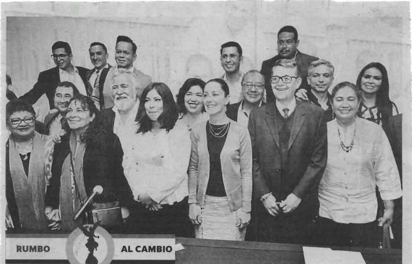
· La Jefa de Gobierno electa, con diputados de Morena al Primer Congreso de la CDMX