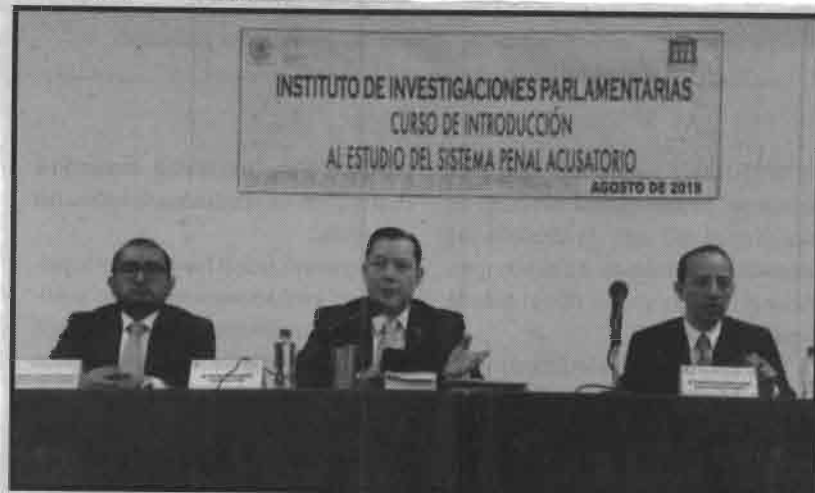
El curso duró cuatro días

El curso se dividió en cinco módulos: Introducción a la Teoría del Proceso, Oralidad en materia familiar, Inducción al Juicio Oral en Materia Mercantil, Juicio Oral en Materia Civil e Introducción al Sistema Penal Acusatorio en la Ciudad de México.