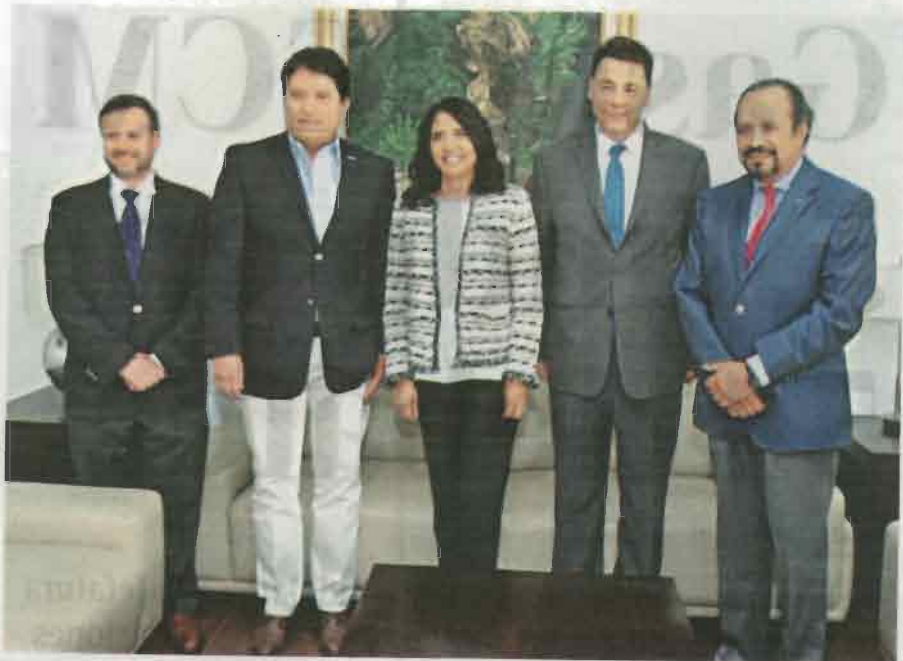
La candidata se entrevistó con integrantes de la Cámara Nacional de la Industria de la Construcción

Respecto a una supuesta empresa fantasma que el Gobierno de la Ciudad de