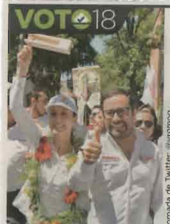
Sheinbaum visitó ayer la Miguel Hidalgo.

Sin embargo, explicó que en el oriente de la CD-MX sería a mediano plazo a partir de sustituir los pozos por otras fuentes de abastecimiento como la captación de agua de lluvia.