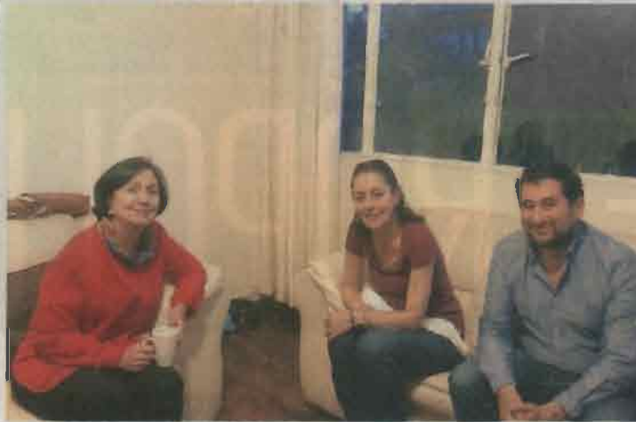
Amalia García, Claudia Sheinbaum y César Cravioto