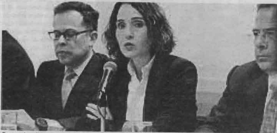
Pese a localizarse en área protegida y federal, Sedema avaló la edificación.

Subrayó "ante el cúmulo de anomalías, es inaceptable que las autoridades se hayan limitado a sancionar a la empresa constructora con una compensación económica de poco más de 5 millones 417 mil pesos, de los cuales 4 millones se destinarían a la creación de un sistema de riego para el vivero Nezahualcōyotl, ubicado en la colonia Ciénega Grande, en la delegación Xochimilco, mientras el resto se depositaría en el fideicomiso del Fondo Ambiental Público de la ciudad".