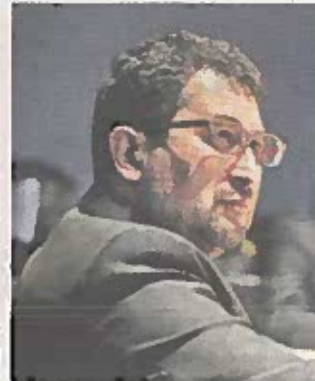
■ El diputado de Morena pidió investiguen las manifestaciones del domingo.

REFORMA publicó el domingo que, en protestas con los mismos carteles contra el candidato de Morena, manifestantes dijeron ser del Sindicato Único de Trabajadores del Gobierno de la Ciudad de México.