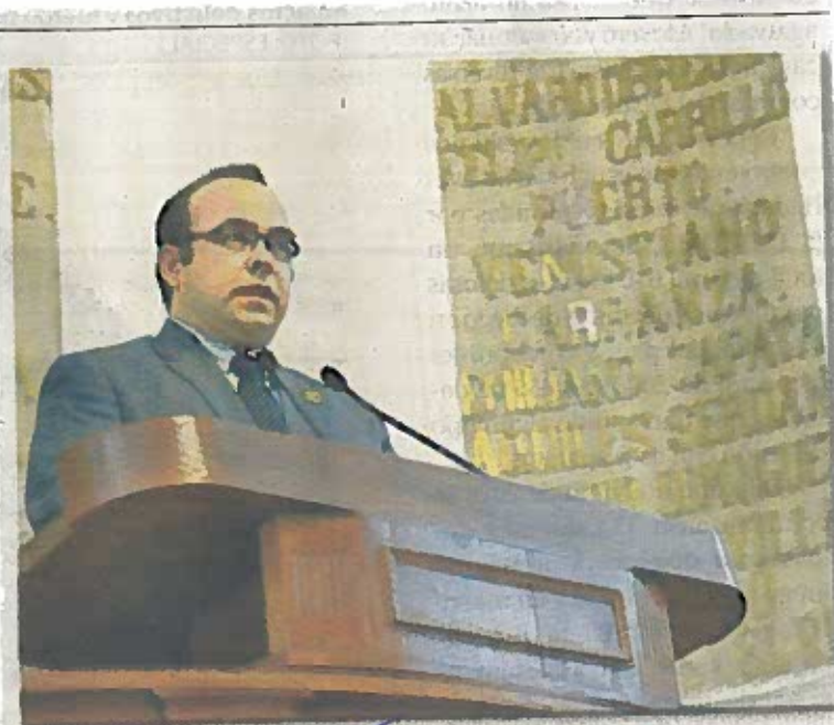
El diputado Miguel Ángel Abadía Pardo, integrante de la Comisión de Gobierno en la Asamblea Legislativa.

En este sentido, dijo que ya existen pláticas con las autoridades ambientales locales y federales, así como de expertos en la materia para desahogar esta iniciativa del GPPAN.