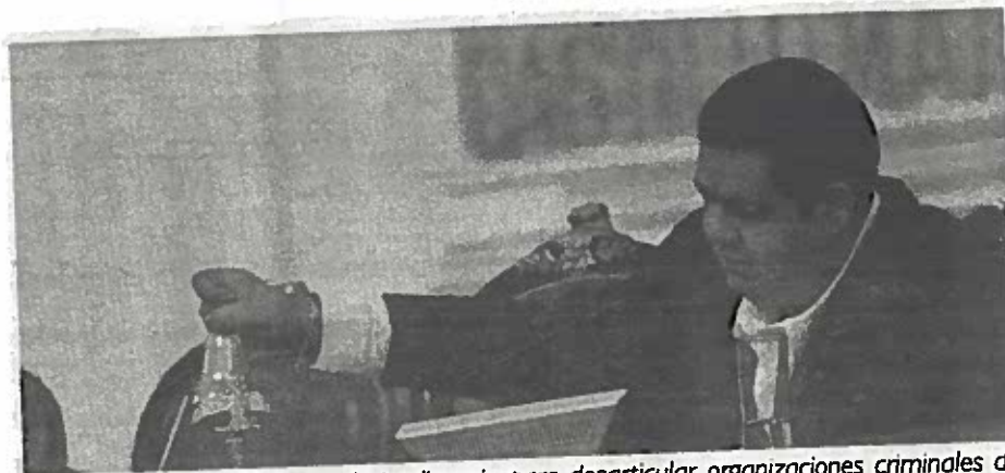
Se debe intensificar labores de inteligencia para desarticular organizaciones criminales de extranjeros.

Indicó, el Tribunal Superior de Justicia de la capital ha dictado sentencia, condenatoria o absolutoria entre 2012 y mayo de 2017, a 422 extranjeros y 45 de cada 100 resultaron ser colombianos. Robo es lo que más cometen: 161 de las 191 condenas para estas personas fueron por este delito. Mientras que 100, fueron por hurto a casa-habitación.