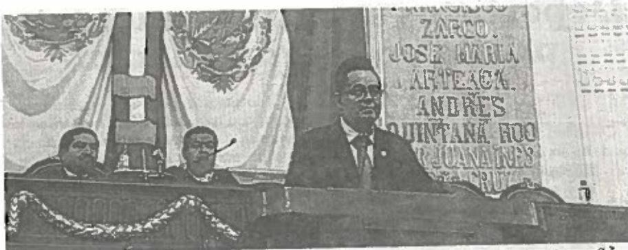
Un 34% de las mujeres, a nivel nacional manifestó haber experimentado agresiones físicas a lo largo de su vida.

Dijo que las entidades que presentan los niveles más altos de violencia contra las mujeres son la Ciudad de México, Estado de México, Jalisco, Aguascalientes y Querétaro. Por el contrario, las que tienen la prevalencia más baja son San Luis Potosí, Tabasco, Baja California Sur, Campeche y Chiapas. Las agresiones a las mujeres se ejercen en diferentes ámbitos de la vida: en el escolar, en el familiar, laboral y en comunitario.