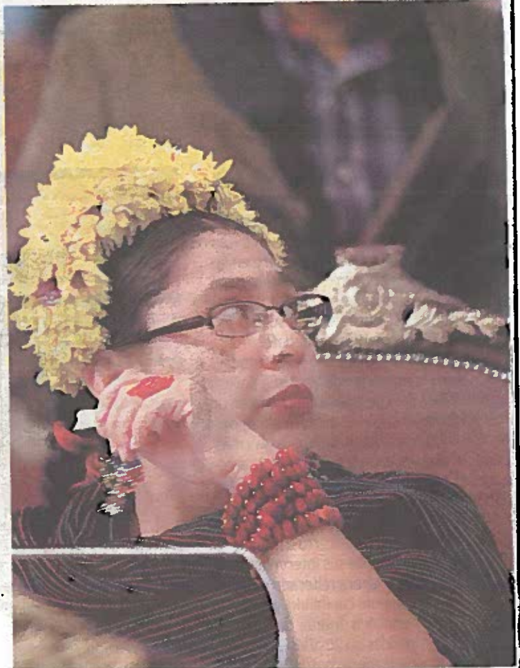
La diputada local del PVEM.