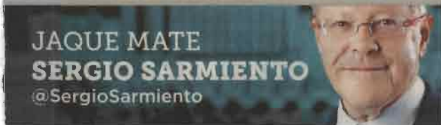
JAQUE MATE SERGIO SARMIENTO @SergioSarmiento

La industria petrolera se debilitó por restricciones a la inversión. La reforma energética ha generado compromisos de inversión por 200 mil millones de dólares.