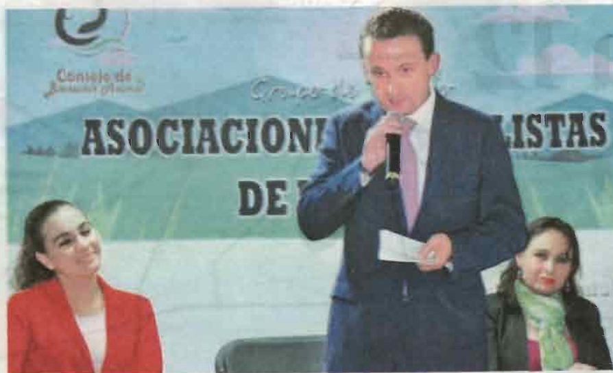
El priista se manifestó en contra de la pelea de perros