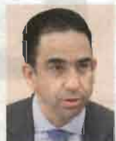
Javier Lozano Senador independiente "No sólo es un joven

la PGR que investigue lo más rápido posible las acusaciones (...) Es gravísimo que podamos tener un Presidente bajo sospecha de que es un lavador de dinero"