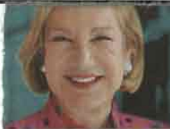
GUADALUPE LOAEZA gloaezatovar@yahoo.com

Claudia Sheinbaum, convencida de que no se puede ser de izquierda y corrupto a la vez, está lista para ser la emperadora de la CDMX.