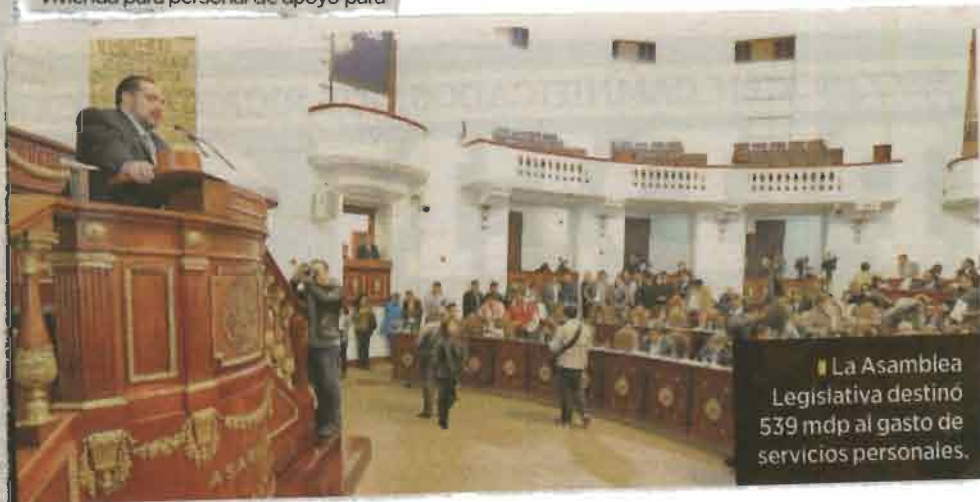
La Asamblea Legislativa destinó 539 mdp al gasto de servicios personales.