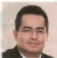
Leonel Luna Estrada Presidente de la Comisión de Gobierno de la ALDF

“Los damnificados del S-19 siguen en espera de resultados y su tragedia no debe politizarse. La SCJN tiene la última palabra de la discusión jurídica de las facultades; la ALDF no maneja la partida presupuestal ”