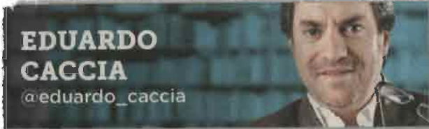
EDUARDO CACCIA @eduardo_caccia

La venta de información de credenciales para votar matiza un país en donde todo es sujeto a negocio ilícito.