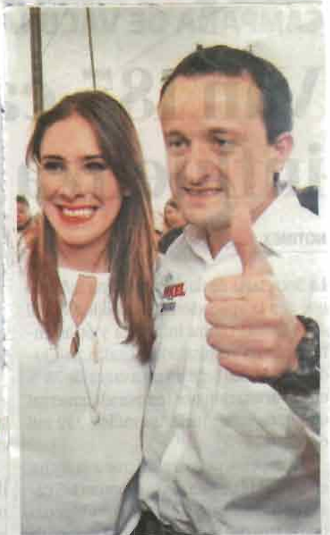
El aspirante priista se reunió con simpatizantes de Tláhuac/NOTIMEX

Recordó que se plantea invertir en un millón de nuevas cámaras de vigilancia para las calles, así como dar capacitación e incremento de sueldo para los cuerpos policiacos y ministerios públicos. Asimismo, contemplan la construcción de 100 kilómetros de nuevas líneas del Metro en la Ciudad de México.