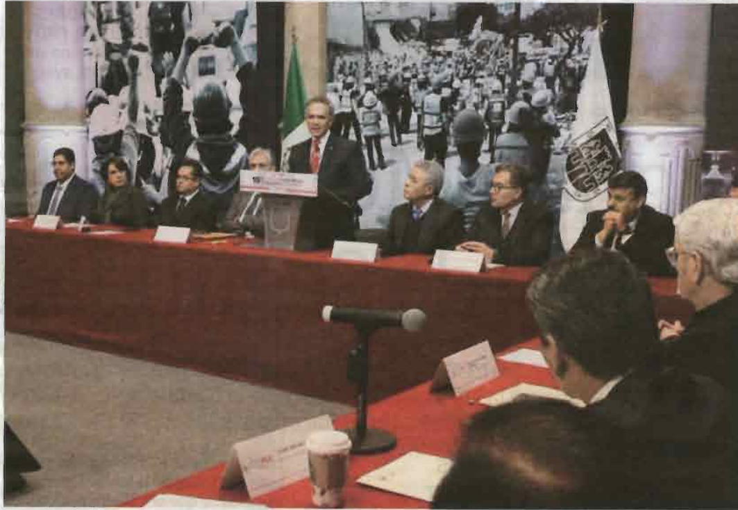
MIGUEL Mancera (centro), Jefe de Gobierno, en la reunión con su gabinete, ayer.