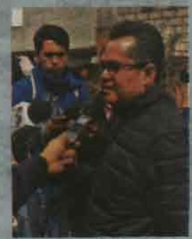
El diputado del PRD dijo que los morenistas ni trabajan en el tema.