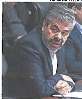
• YA ES HORA. Flores urgió a Morena tener voluntad política.