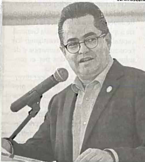
EL DIPUTADO del PRD prevé que la alianza se concrete pronto