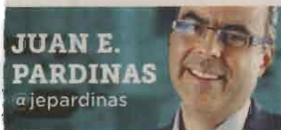
JUAN E. PARDINÁS @jepardinas

El endeudamiento excesivo con EPN deja muy vulnerables las finanzas públicas.