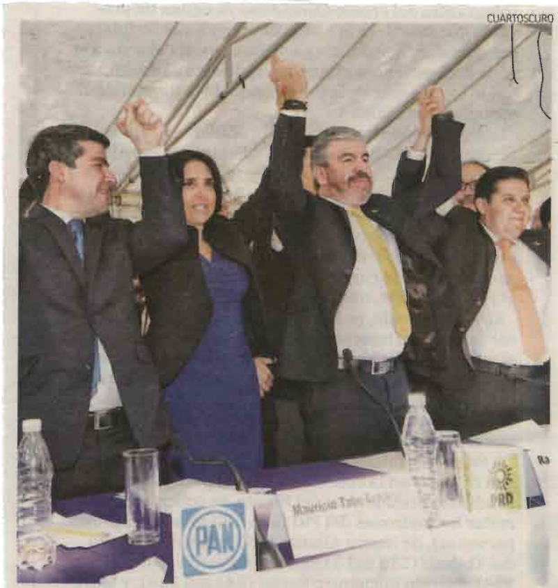
JUNTOS. Los dirigentes del PAN, PRD y MC, ayer en Instituto Electoral de la CDMX.

Añadió que los capitalinos exigen abandonar los intereses partidarios para centrarse en los problemas de la sociedad, por lo que hay que cambiar la lógica tradicional de la política y empoderar a los ciudadanos.