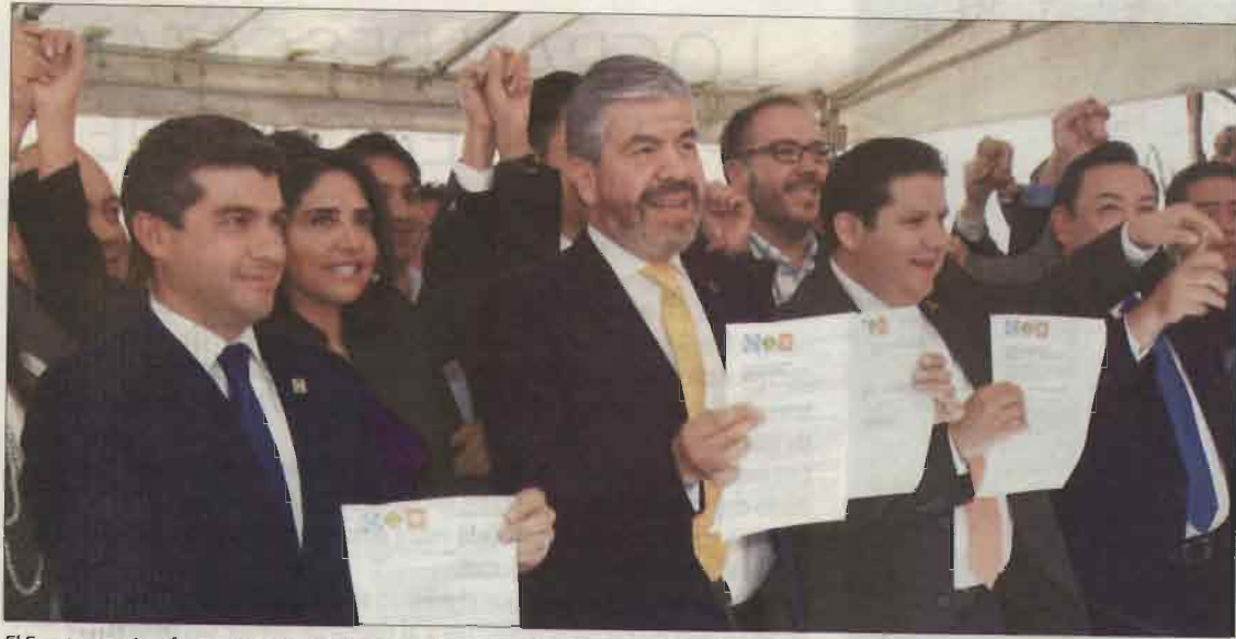
El Frente opositor fue registrado el 5 de septiembre ante el Instituto Nacional Electoral.