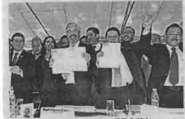
■ Hay Frente en la CDMX