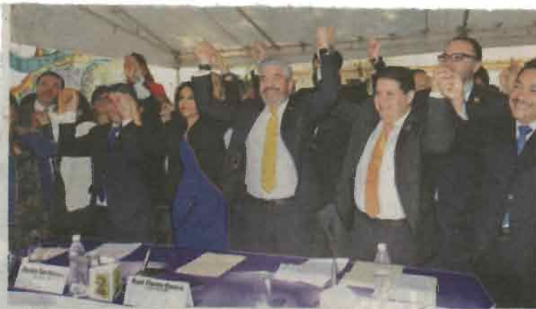
El 'Acuerdo por la CDMX' lo integran PRD, PAN y Movimiento Ciudadano.

"Estamos en esta etapa, que es la etapa de la conformación del programa, vamos a seguir trabajando para decirle con claridad, en éste caso a los capitalinos, qué proponemos para resolver los problemas que hoy están