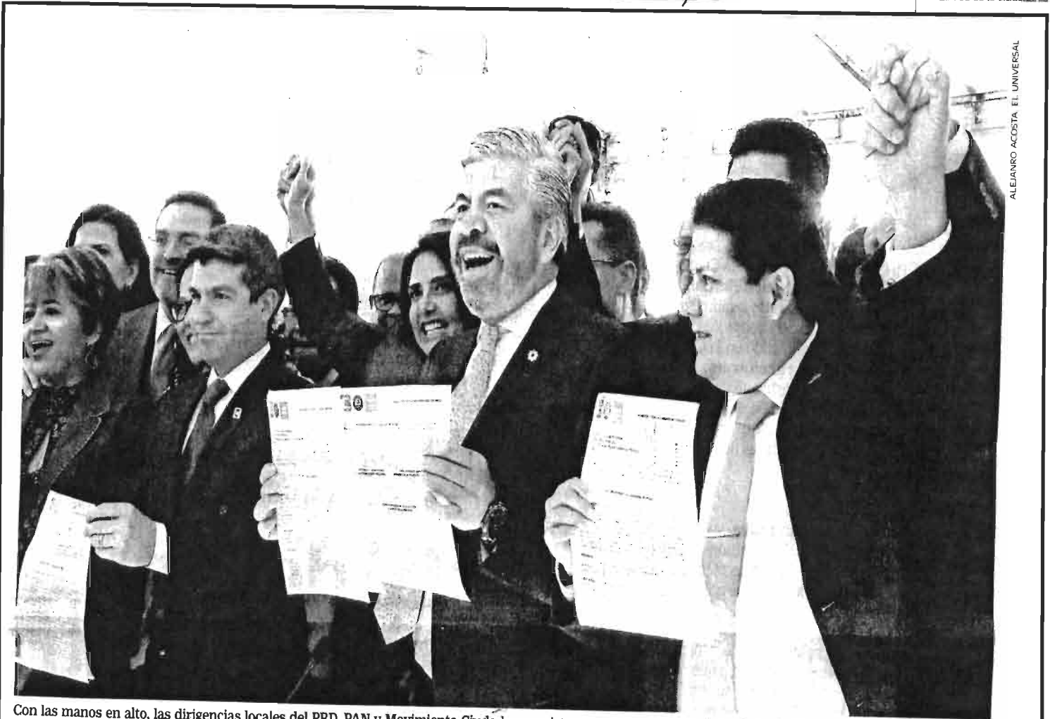
ALEJANDRO ACOSTA / EL UNIVERSAL