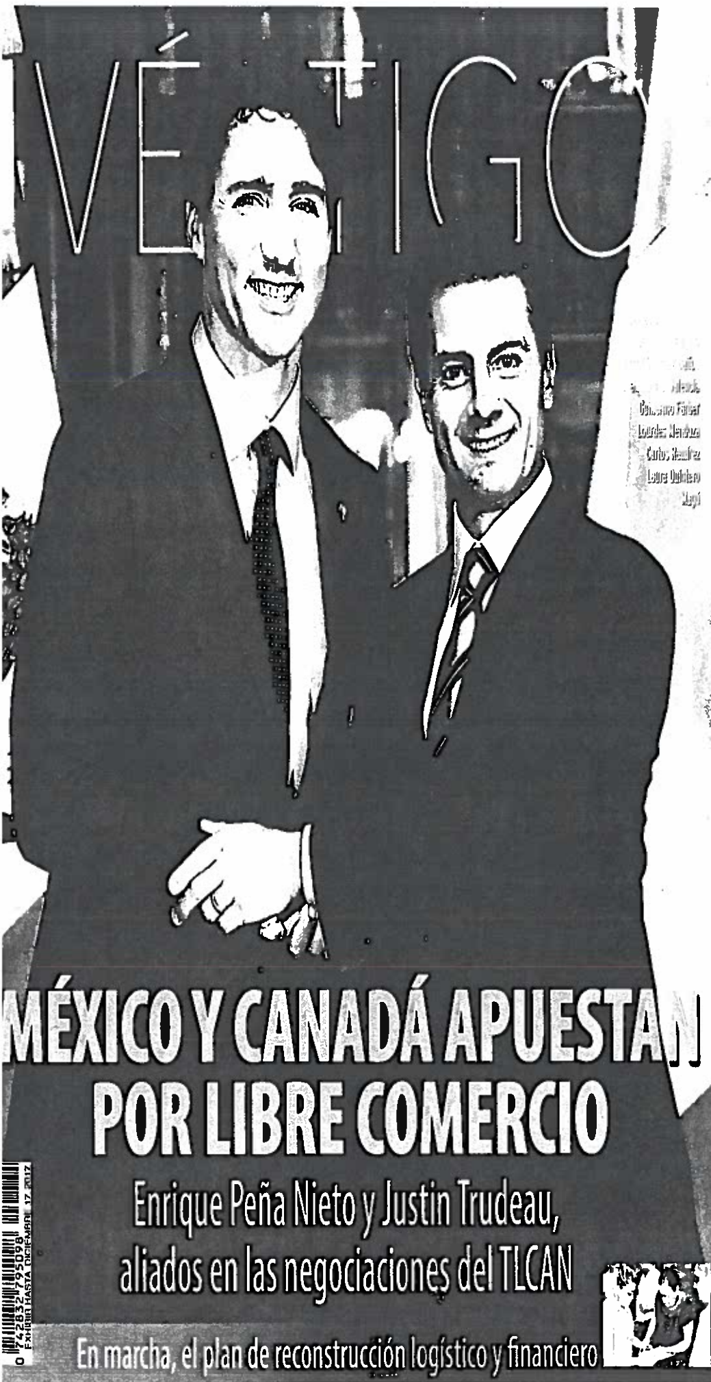
Enrique Peña Nieto y Justin Trudeau en un momento de la cumbre de la Alianza por el TLCAN.