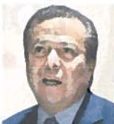
César Camacho Líder de diputados del PRI

"Tengo la certeza fundada de que en el próximo periodo ordinario, uno de los primeros asuntos que se verán en el pleno será el dictamen de Ley de Seguridad Interior"