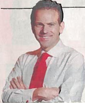
Carlos Loret de Mola