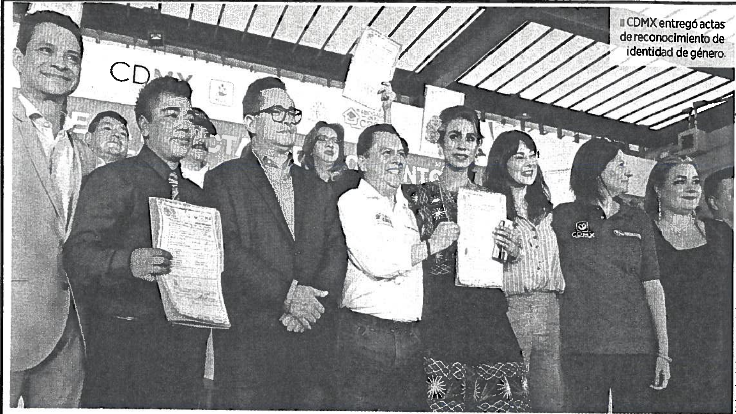
■ CDMX entregó actas de reconocimiento de identidad de género.