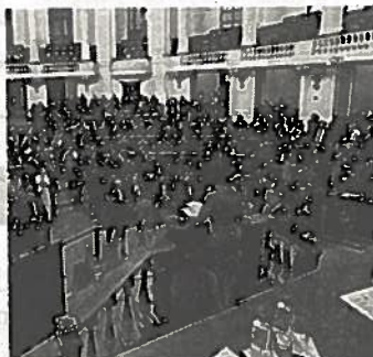
■ Perredistas lamentaron la actitud negativa de Morena

Después de ser aprobados los once dictámenes que dieron origen al Sistema local Anticorrupción con la adver-