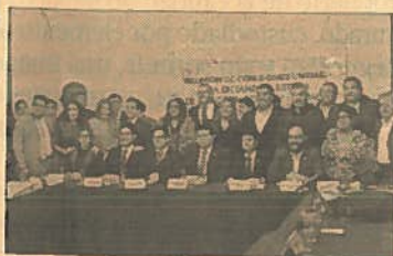
Asambleístas discutieron y aprobaron las 11 reformas que dan vida al Sistema Anticorrupción de la Ciudad de México.

En la Ley Orgánica y Reglamento Interno de la ALDF se hizo una reforma para que los diputados locales puedan designar al Contralor de la capital, quien auditará la ad-