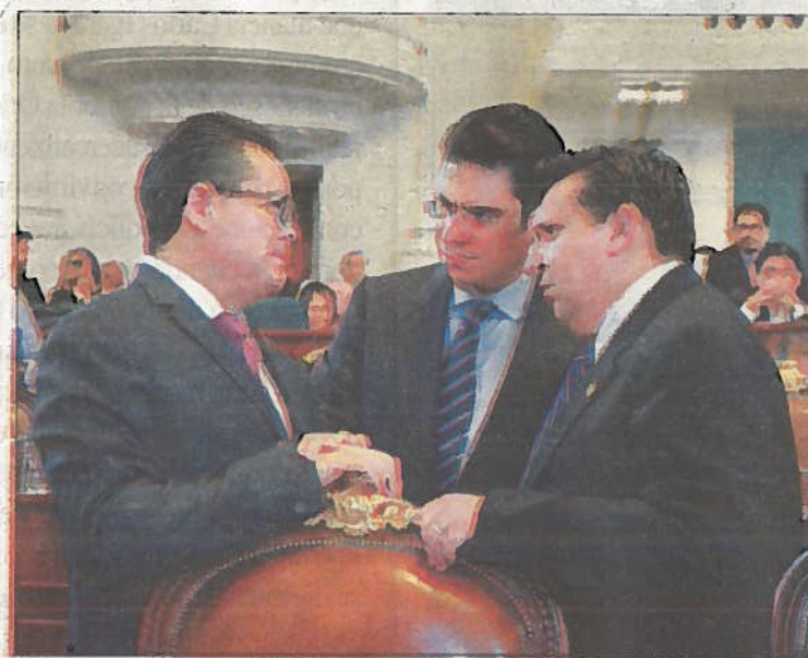
Los líderes de las bancadas discutieron sobre las modificaciones a la ley.

La ALDF tendrá 30 días naturales después de recibir la propuesta del titular de la administración local para aprobar al Con-