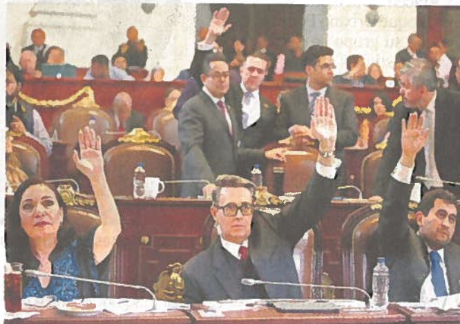
■ Los diputados lograron crear el Sistema Anticorrupción a modo, contrario a lo solicitado por asociaciones civiles.