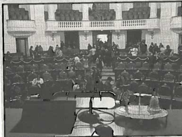
Fuerte reclamo a Morena en la ALDF.

A principios de mayo pasado, las Comisiones Unidas que trabajaron los dictámenes se declararon en sesión permanente y realizaron diversas reuniones para discutir el contenido de las iniciativas, por lo que rechazó que haya algunos diputados que se digan "sorprendidos" por el trabajo hecho. (Notimex)