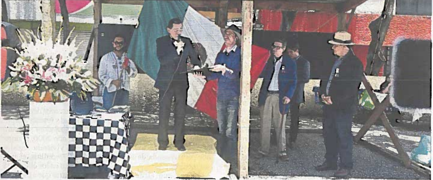
■ Benito Juárez subió al templete y proclamó el Manifiesto a la Nación, esta vez en la colonia que lleva su nombre.