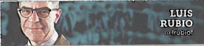
LUIS RUBIO @lrubiof

Las reformas que Carlos Salinas emprendió fueron profundas, pero no generalizadas: dejaron a la mayoría lejos de la modernidad.