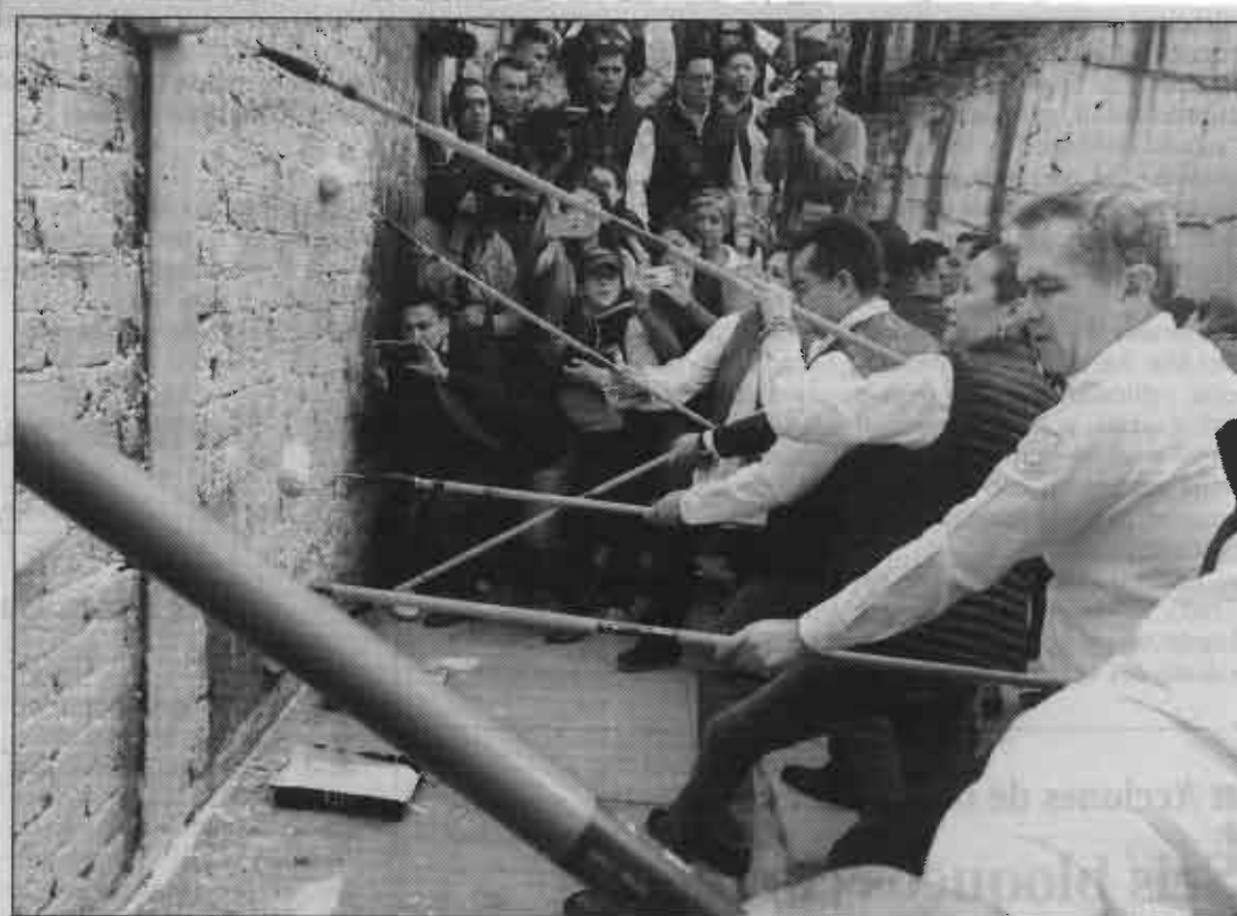
El jefe de Gobierno de la Ciudad de México, Miguel Ángel Mancera Espinosa, encabezó ayer el programa Tu ciudad te re-quiere, en la colonia Golondrinas, delegación Álvaro Obregón, donde estrenó formato, ya que además de pintar, balizar o barrer jardines, camellones y calles, las autoridades ofrecen todos los programas sociales de la administración local