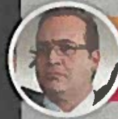
Javier Duarte Veracruz