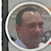
Roberto Borge Angulo Quintana Roo