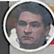
Tomás Yarrington Tamaulipas