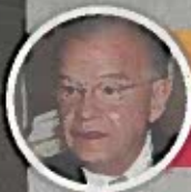
Andrés Granier Tabasco