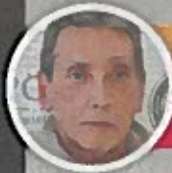
Mario Villanueva Quintana Roo