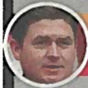
Rodrigo Medina Nuevo León