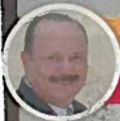
César Duarte Chihuahua