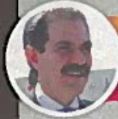
Guillermo Padrés Sonora