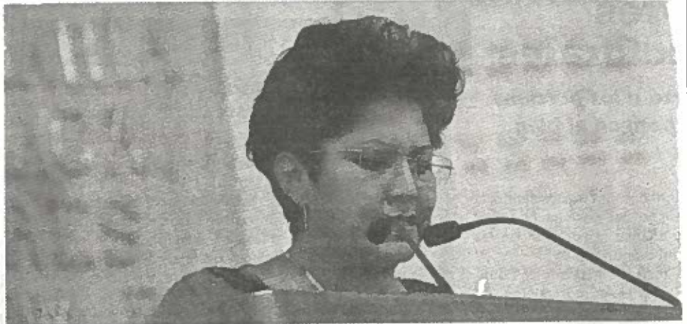
No quieren más "Juanitas" en procesos electorales.

Coincidió en que ésta debe ser la prioridad antes de que termine mayo, ya que hay un plazo que vence para que el Instituto Electoral del Distrito Federal trabaje en el proceso comicial del próximo año, "de lo contrario se pondrían en riesgo las elecciones del 2018 y se enfrentaría un problema serio de gobernabilidad e institucionalidad".