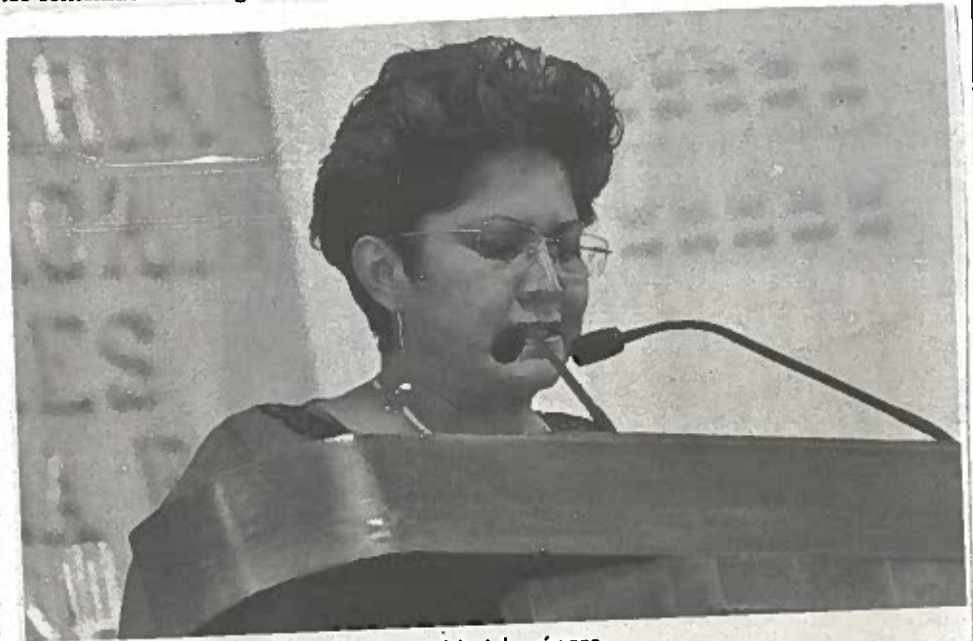
La legisladora pidió garantizar la equidad de género.

Ruiz celebró el anuncio que hizo el presidente de la Comisión de Gobierno de la ALDF, Leonel Luna Estrada, quien afirmó que se aprobará en tiempo y forma la ley electoral y así evitar que se pongan en riesgo los comicios de 2018 en la capital del país.