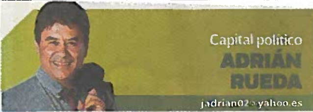
Capital político ADRIÁN RUEDA