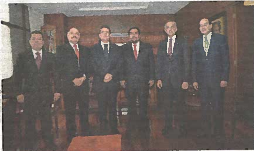
Acude Mancera a toma de posesión del nuevo titular del TSJCDMX.