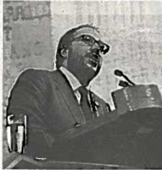
Toledo reafirma apoyo a MAM

Asimismo, el también presidente de la Comisión de Presupuesto y Cuenta Pública de la ALDF reafirmó su compromiso de los militantes del PRD a favor de Miguel Ángel Mancera, para ser el