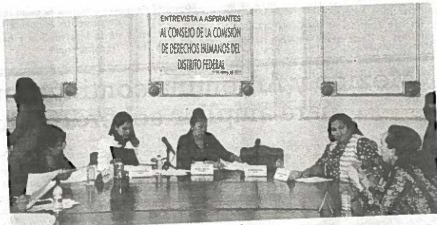
Inició pasarela de aspirantes a Consejo Honorífico.