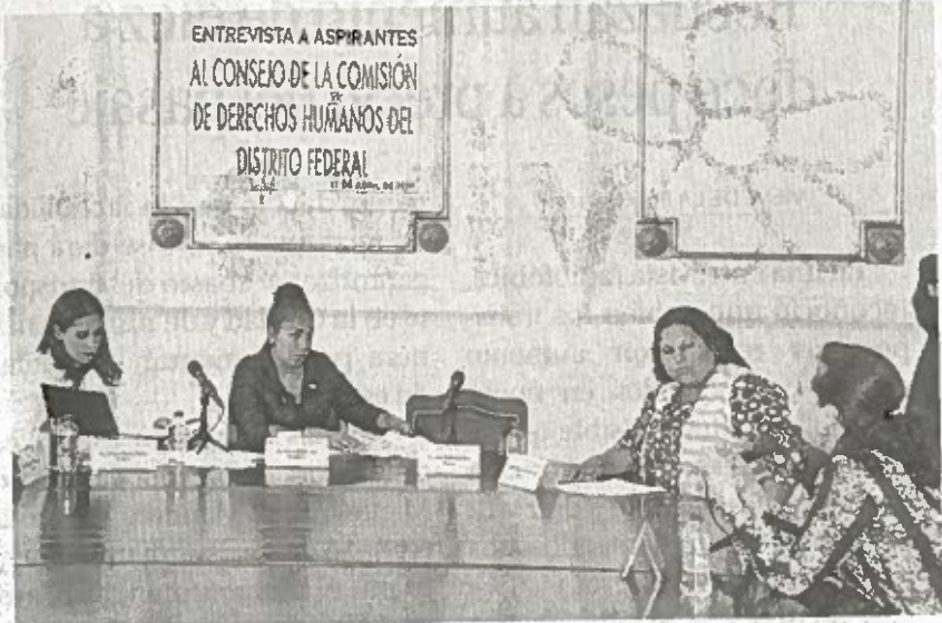
LOS ASAMBLEÍSTAS comenzaron ayer a entrevistar a ocho de los 14 aspirantes.