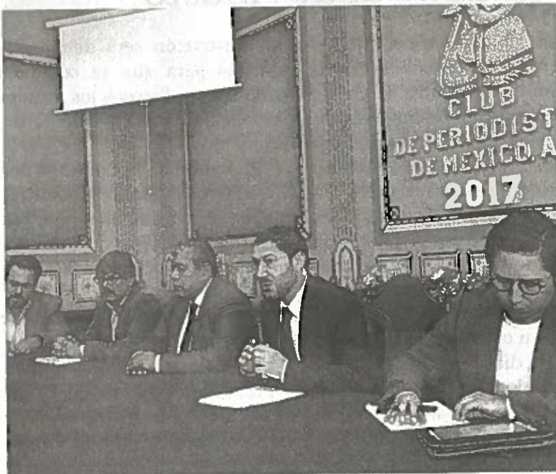
ASAMBLEÍSTAS DEL partido Morena.