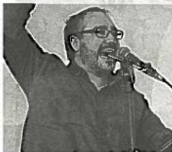
■ Toledo cuestiona mecanismo del INE

Expuso que el INE realizó la nueva demarcación territorial de la Ciudad basado en líneas políticas, no técnicas, geográ-