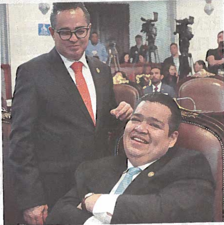
IVÁN TEXTA Solís, presidente de la Comisión de Vigilancia de la Auditoría Superior capitalina en la Asamblea Legislativa.