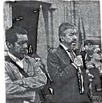
PRD pide a Corte no ceder ante presiones