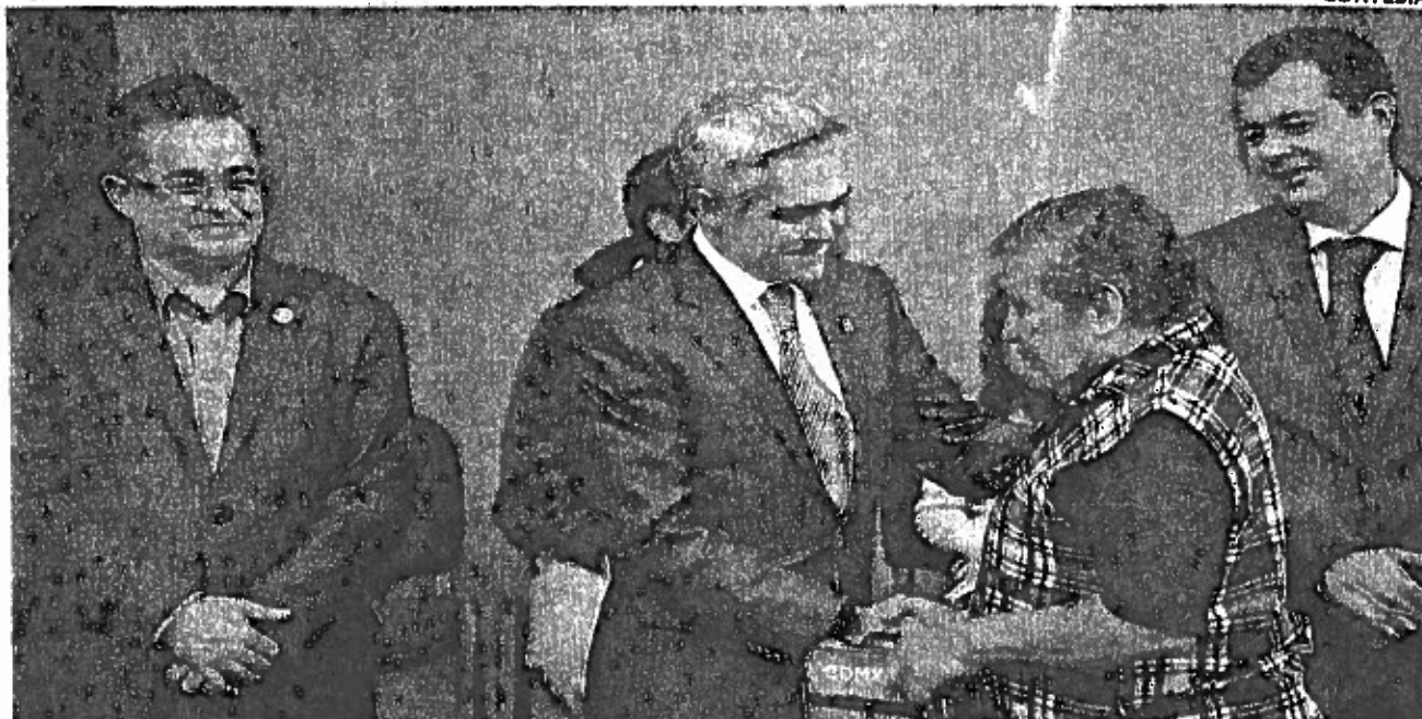
EL JEFE de Gobierno, Miguel Ángel Mancera, explicó que para este año se destinaron 20 millones de pesos para beneficiar a dos mil 500 personas con discapacidad auditiva.