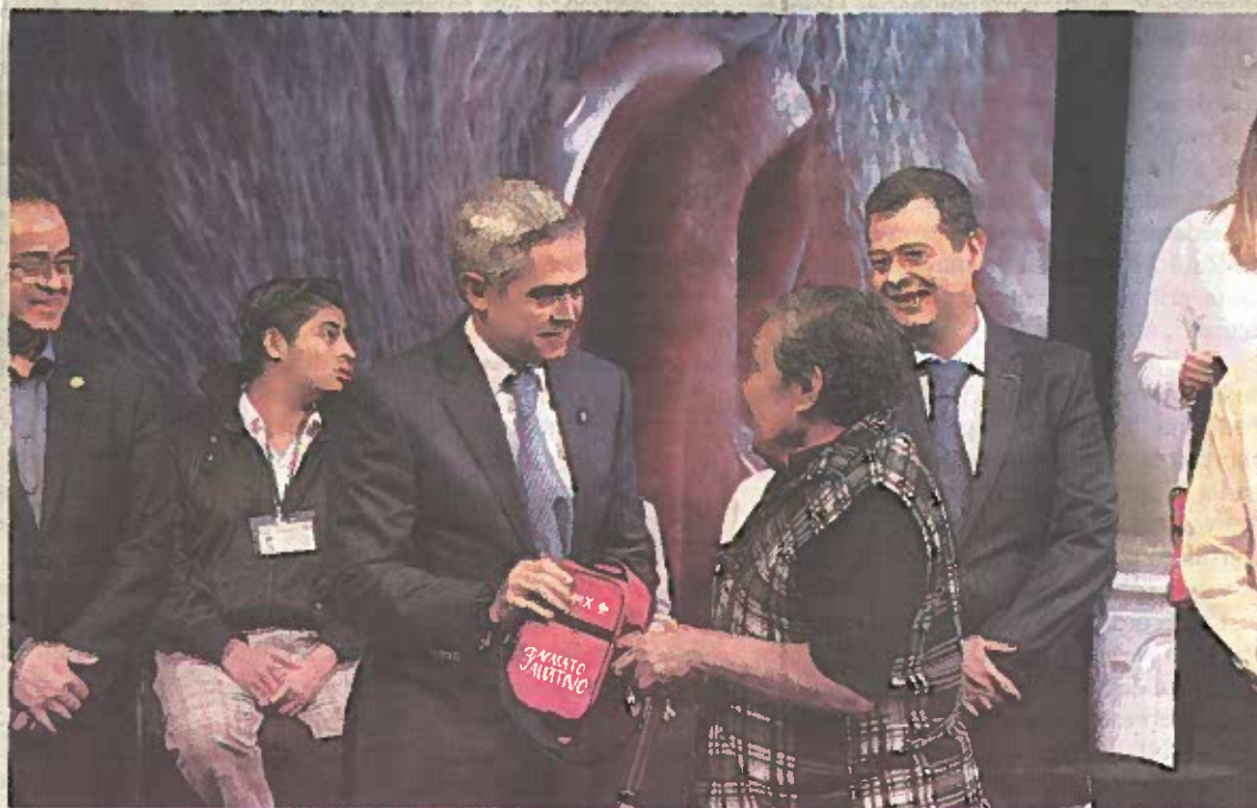
El jefe de gobierno capitalino, Miguel Ángel Mancera Espinosa, firmó el decreto por el que se promulga y publica la Ley de Aparatos Auditivos Gratuitos de la Ciudad de México.