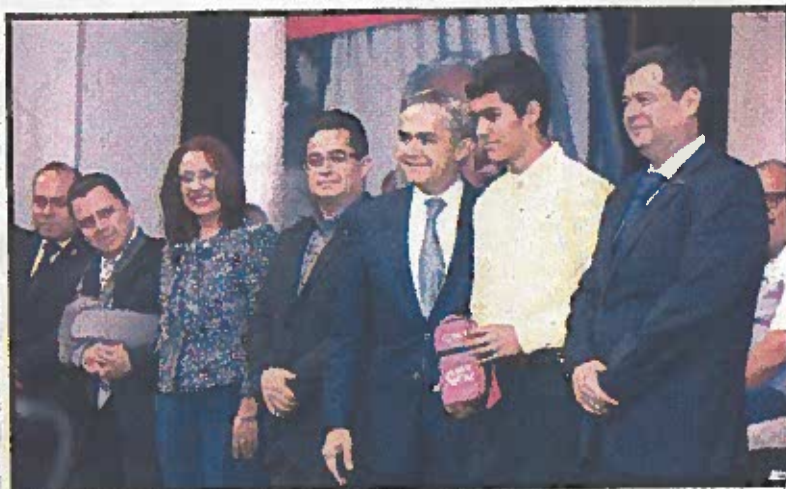
Miguel Angel Mancera, durante la promulgación de la Ley de Aparatos Auditivos Gratuitos de la Ciudad de México.