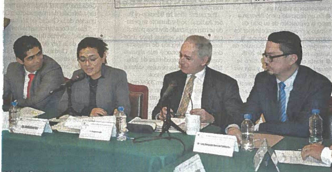
En el foro con motivo del Sistema Nacional Anticorrupción, los especialistas precisaron que la participación de los ciudadanos ha sido la fórmula para reducir la corrupción en países latinoamericanos