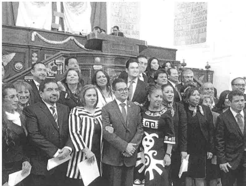
Los nombramientos se dieron con la oposición del grupo parlamentario de Morena