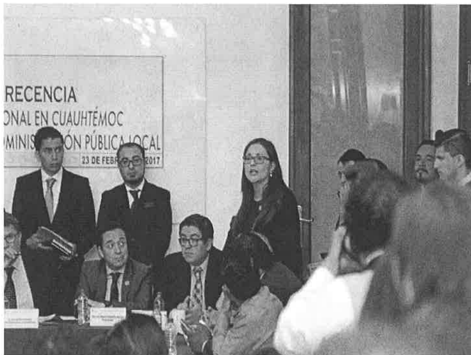
López no permitió que cuestionaran al delegado de la Cuauhtémoc.