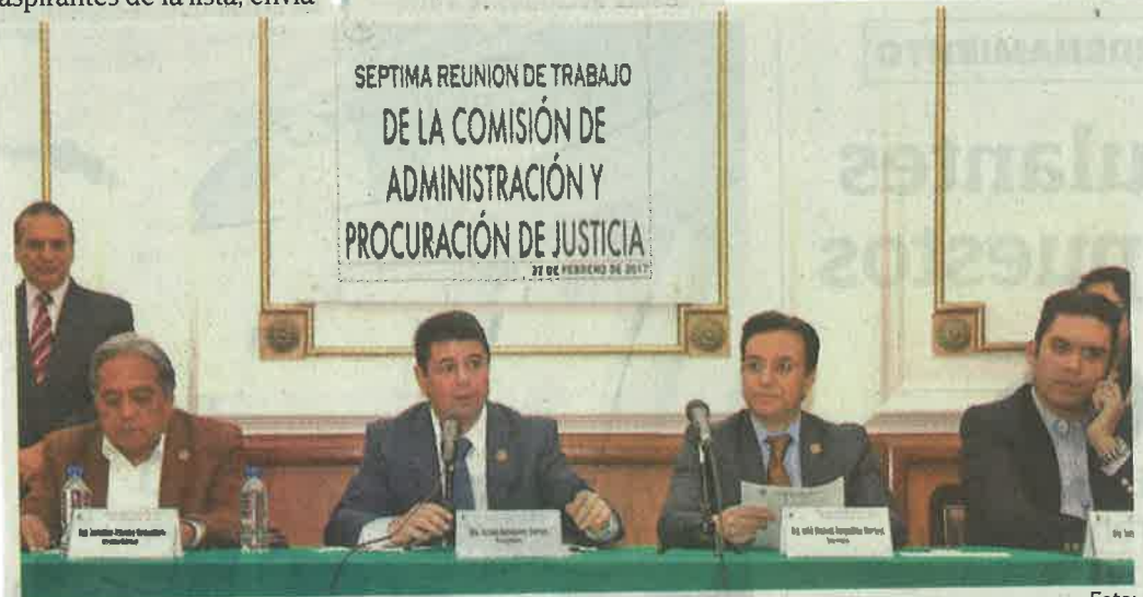
REUNIÓN. Diputados de la Comisión de Procuración de Justicia de la Asamblea Legislativa votaron a favor de los siete aspirantes a magistrados, quienes fueron propuestos por el jefe de Gobierno.