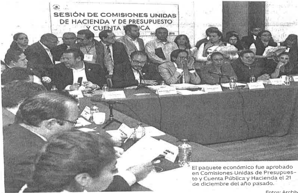
El paquete económico fue aprobado en Comisiones Unidas de Presupuesto y Cuenta Pública y Hacienda el 21 de diciembre del año pasado.