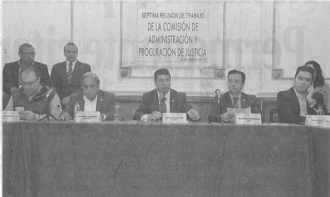
UNA VEZ aprobados los dictámenes se someterán a discusión y en su caso aprobación de los legisladores.