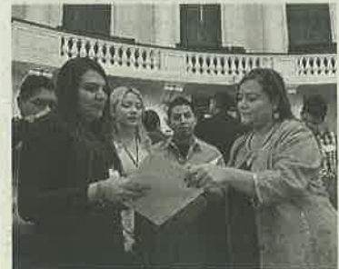
■ Lllaman a atender quejas

ce a la Comisión de Derechos Humanos capitalina (CDH-CD-MX) y a la Contraloría en Miguel Hidalgo, para que atiendan las quejas de dicho grupo en relación a vejaciones y violaciones a sus garantías individuales, de las que han sido objeto por parte de la Policía Auxiliar y de la Policía Preventiva. ☺