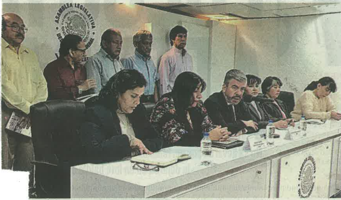
■ Demandan investigar licitaciones en Cuauhtémoc