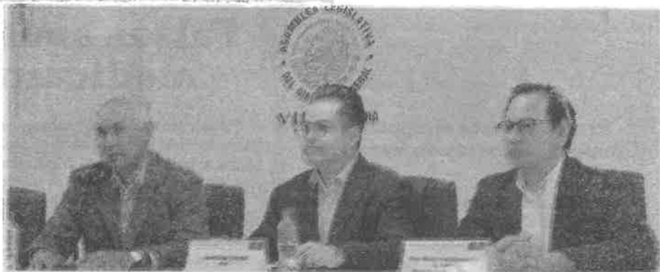
Analizarán bases, principios y procedimientos a los que tienen derecho toda persona en materia de protección de datos personales.