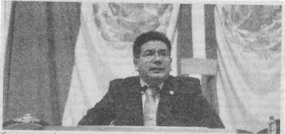
Comienzan atender a migrantes repatriados de los Estados Unidos.

De acuerdo con el Instituto Nacional de Migración, en 2016 hubo 204 mil 855 eventos de repatriación por los módulos de la frontera, de los cuales el 92.5 por ciento, es decir, 202 mil 279 mexicanos repatriados aceptaron uno o varios apoyos que se ofrecen.