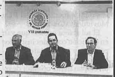
■ Proponen proteger datos