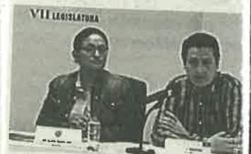
Tienen 3 planteamientos