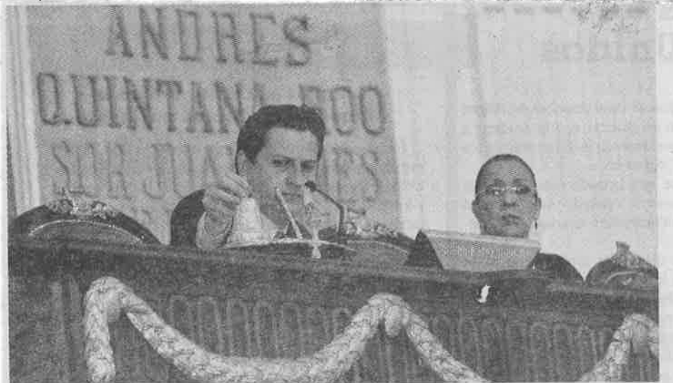
Se debe detener la liberalización del precio de los combustibles.

Añadió, "insisto, esta liberalización y el aumento de casi el 60% en este sexenio es un impuesto similar al IVA para contrarrestar el subsidio que dejó de dar al Ejecutivo por 200 mil millones de pesos que no se tienen y que hay que buscar".