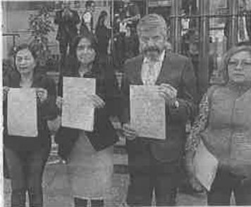
PRD llama a defenderse

Ciudad de México.- Ahora correspondió a los perredistas ampararse ante un juzgado de distrito en materia administrativa contra el gasolinazo y los precios diferenciados de los combustibles que la administración peñista impuso para la Ciudad de México y que entrarán en vigor durante el mes de febrero.