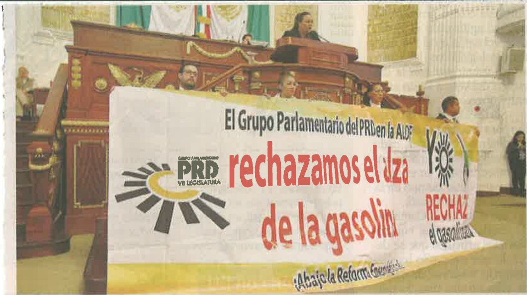
■ En Donceles, el PRD exigió medidas de austeridad, aunque no lanzó propuestas concretas.