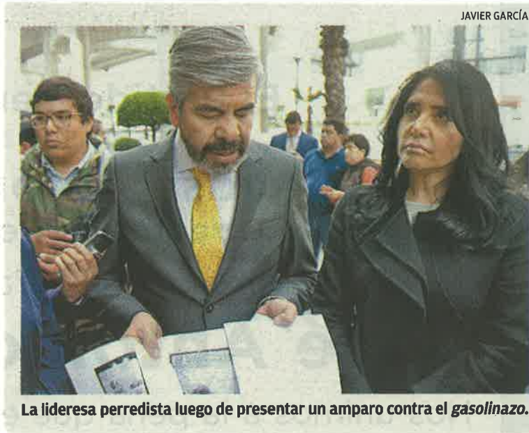
La lideresa perredista luego de presentar un amparo contra el gasolinazo .