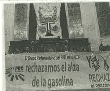
■ En la primera sesión del año