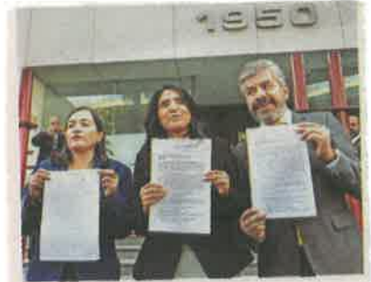
Acción. Alejandra Barrales, líder del PRD, encabezó el acto. /CUARTOSCURO

Por su parte, la Asamblea Legislativa del DF (ALDF) envió un exhorto al Congreso para que apruebe un periodo extraordinario de sesiones, con el objetivo de hacer un ajuste al precio de la gasolina. /KARLA MORA