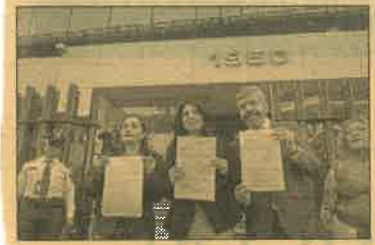
La líder nacional del PRD llevó el recurso a los juzgados federales en materia civil.

La dirigente del PRD también comentó que para las siguientes elecciones del Estado de México, será el próximo viernes cuando de-