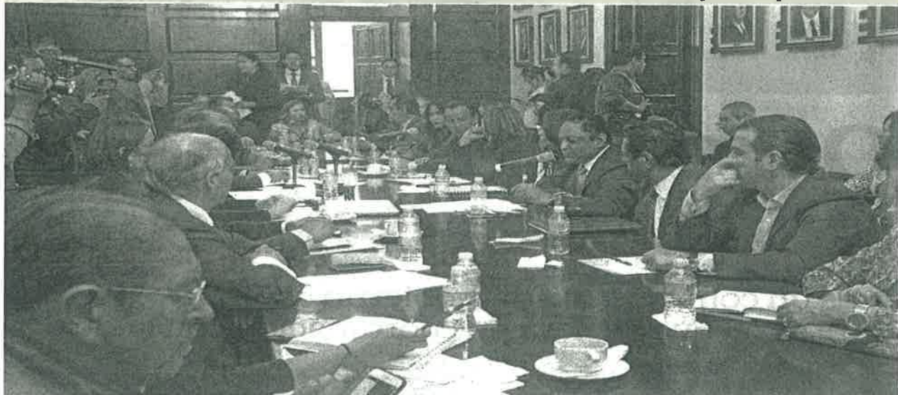
El proyecto de dictamen elaborado por la Comisión de Alcaldías será discutido mañana para después presentarlo ante el pleno de la Asamblea Constituyente.

“Creo que el procedimiento que debemos seguir tiene que ser previamente aprobado por el pleno de la Constituyente, iniciar trabajos específicos, analizar e integrar la próxima mesa de alcaldías”, precisó la perredista. ●