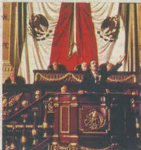
En el cine. En La ley de Herodes (1999), la ALDF sirvió como escenario para los últimos minutos de la cinta.

El Reglamento para el Gobierno Interior de la ALDF señala que este tipo de acuerdos le corresponde hacerlo al oficial mayor y está completamente dentro de las facultades, por lo que no hay anomalías en el permiso. No obstante, dentro del grupo parlamentario de Movimiento Regeneración Nacional (Morena), se solicitó, la semana pasada, a la Comisión de Gobierno información sobre el permiso otorgado a la televisora, misma que no ha sido respondida. /KARLA MORA