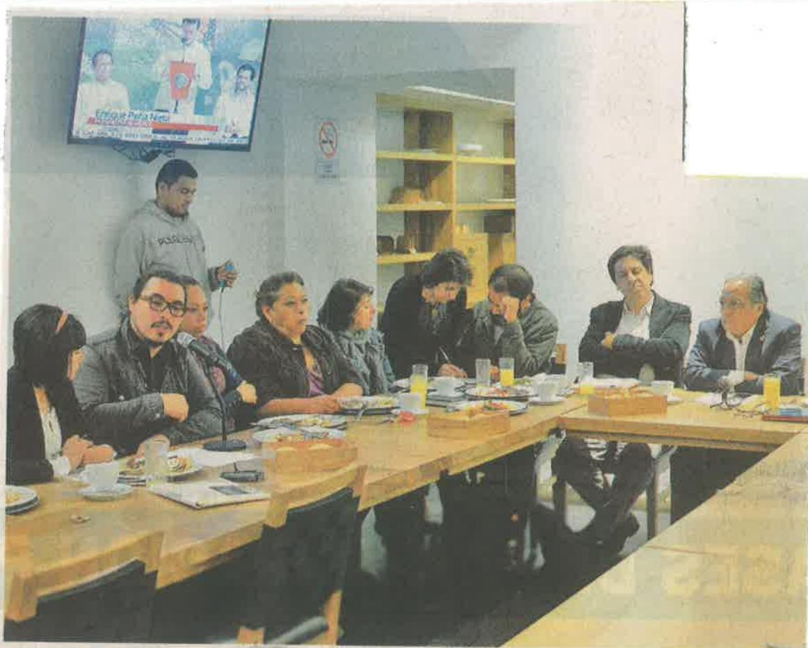
FAMILIARES DE presos políticos se reunieron con asambleístas.