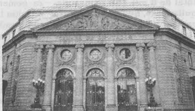
La instancia legislativa.