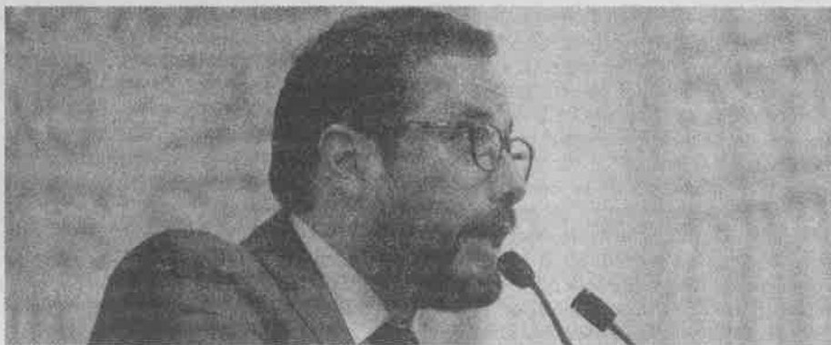
Eliminarlo pondría freno a la impunidad de las autoridades.

Señaló que el fuero debe desaparecer para todos los funcionarios, desde el jefe de gobierno, los delegados que serán alcaldes, los jueces y magistrados y desde luego los legisladores locales, como un primer paso ejemplar para empoderar al ciudadano.