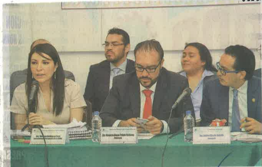
ANUNCIA SUBSECRETARIA de Egresos, Victoria Rodríguez Ceja, que seguirá el cabildeo para obtener más recursos federales.

Al participar en una mesa de trabajo con las comisiones de Presupuesto y Cuenta Pública, así como la de Hacienda de la Asamblea Legislativa, destacó que el gasto de las delegaciones representa el 17.9 por ciento del presupuesto total de la Ciudad.