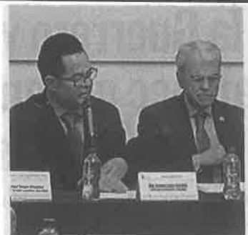
■ Luna dijo que revisarán el desarrollo urbano

Por ello, propuso al secretario de Desarrollo Urbano generar conjuntamente una serie de reuniones de trabajo con diputados y hacer un proyecto de temática para abordar la agenda de la Ciudad de México.