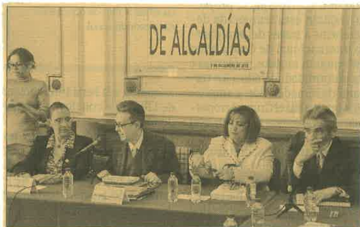
El diputado Alfonso Suárez del Real, saludó la propuesta de la Asamblea Constituyente y destacó que en ella se reconocerá al ciudadano.