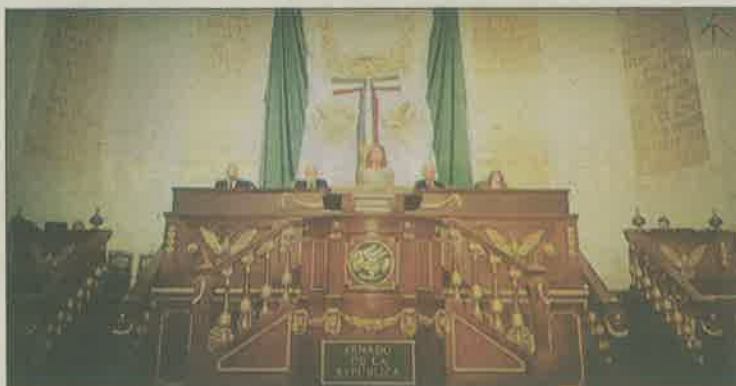
El convenio permite a la televisora crear una réplica de la tribuna.

Fue el pasado sábado 22 de octubre cuando la empresa Televisa grabó algunas escenas y aspectos de la telenovela La Candidata en las instalaciones de la Asamblea Legislativa del Distri-