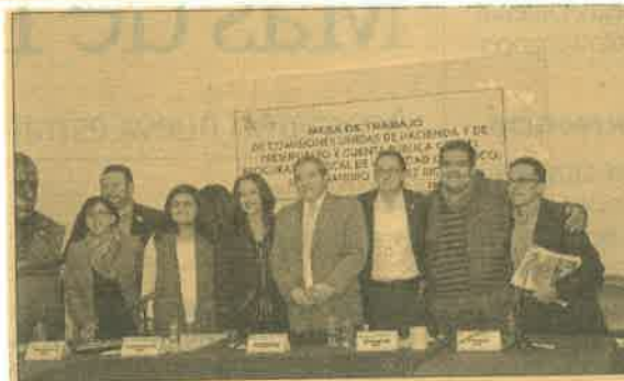
La propuesta entregada reitera los beneficios a la población vulnerable y enfatiza uso de medios electrónicos.

Mencionó que también se prevén exenciones de pago en la expedición de documentos ordenados por la SHCP.