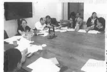
LAS DIVERSAS comisiones de la Constituyente sesionaron ayer.