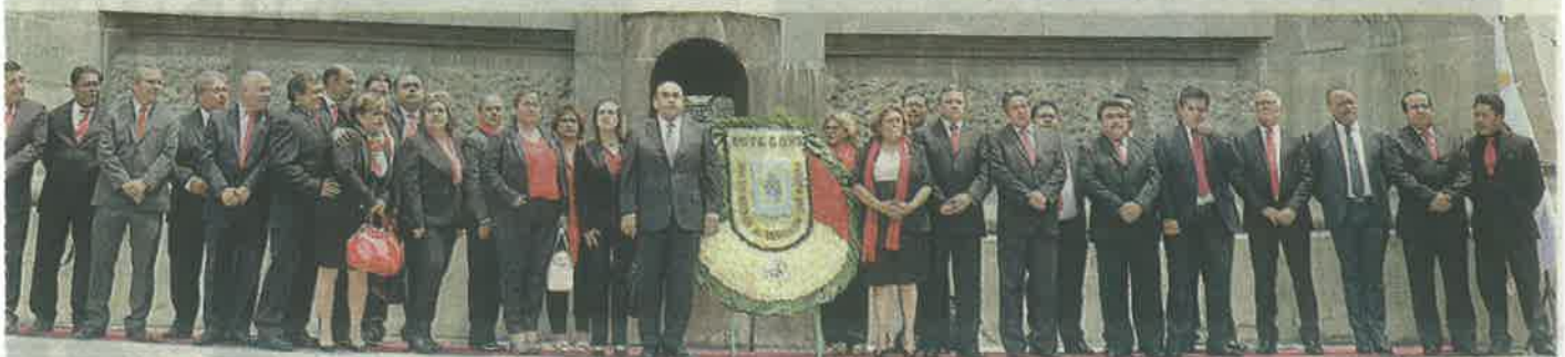
Las y los 42 Secretarios Generales Seccionales del SUTGCDMX, a favor de toda la clase trabajadora

Sólo con mejores salarios puede reactivarse la economía interna, sostiene el Diputado Constituyente Juan Ayala Rivero