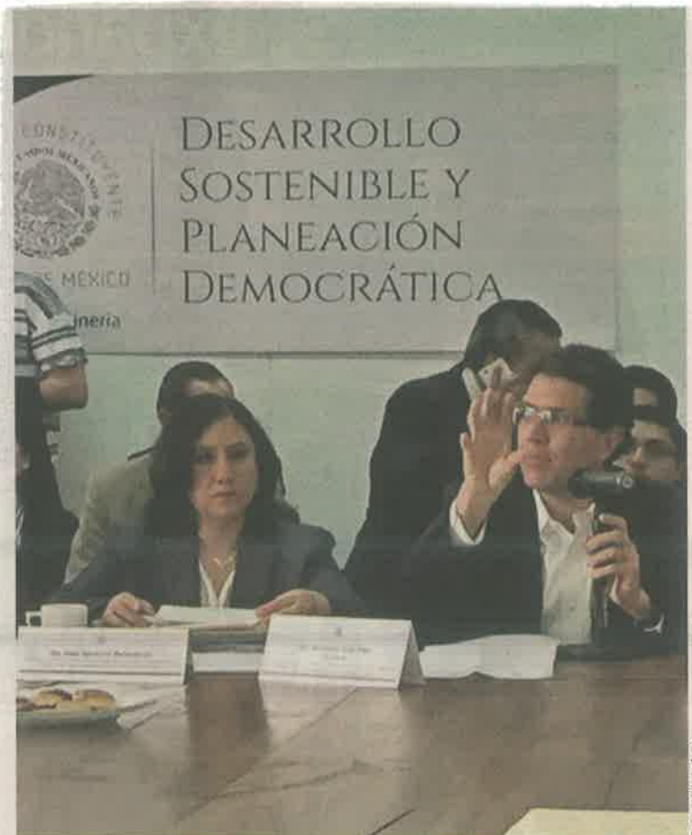
Las comisiones de la Asamblea Constituyente tendrán hasta el 10 de diciembre para entregar los dictámenes.

La Asamblea Constituyente surgió a partir de la declaratoria del Ejecutivo de dar a la Ciudad de México independencia jurídica y por lo tanto puede tener constitución propia.