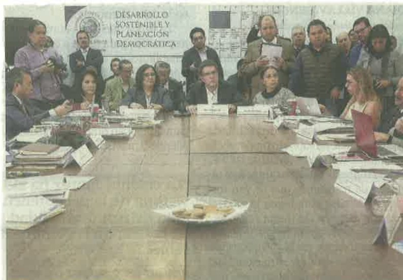
El dictamen fue aprobado en lo general en la Comisión de Buen Gobierno, Combate a la Corrupción y Régimen de Responsabilidades de los Servidores.

También que el servidor público tendrá la obligación de presentar y comprobar las declaraciones sobre su situación patrimonial, cumplimiento de sus obligaciones fiscales y posibles conflictos de interés, que serán publicitadas en los términos que determinen las leyes generales. ●