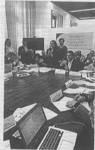
■ En la Asamblea Constituyente