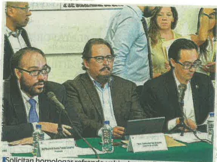
Solicitan homologar refrendo vehicular con Edomex