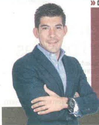
Por Manuel López San Martín