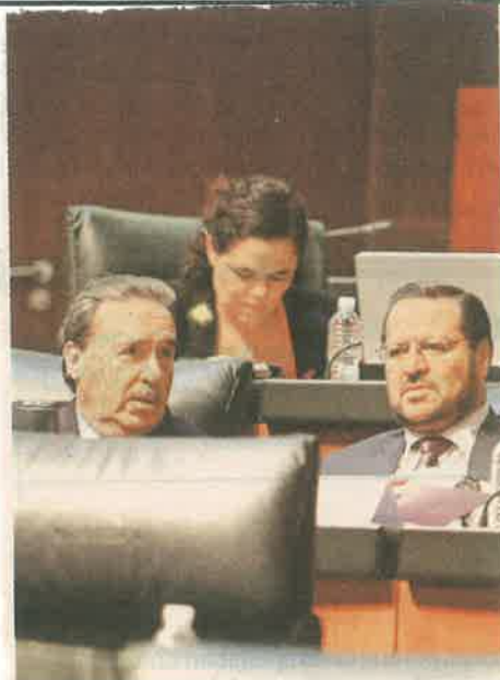
Bancadas. Legisladores integrantes de la Juco- po, en una sesión en el Senado.