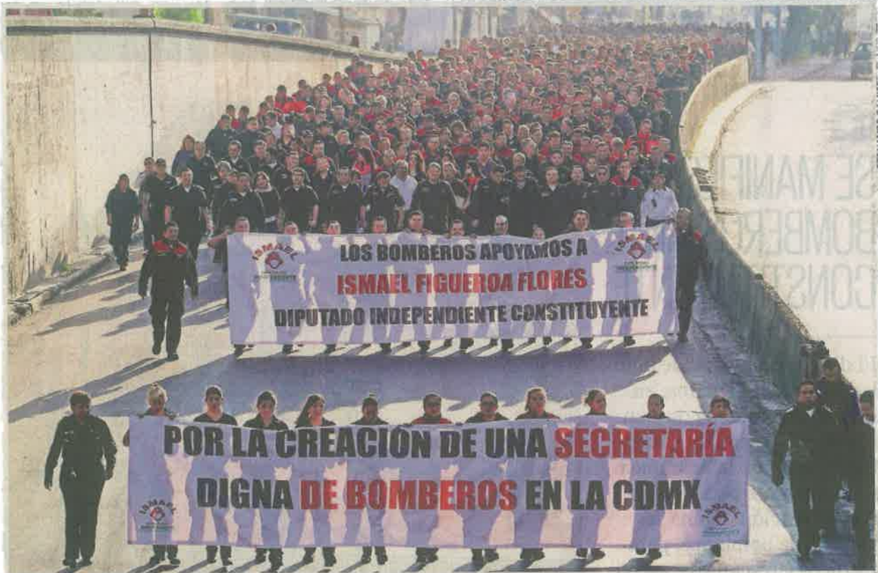
Bomberos y paramédicos, entre otros trabajadores de emergencias y rescates, marcharon de La Viga a la Casona de Xicoténcatl para exigir mejoras a las condiciones laborales y de materiales para su trabajo.