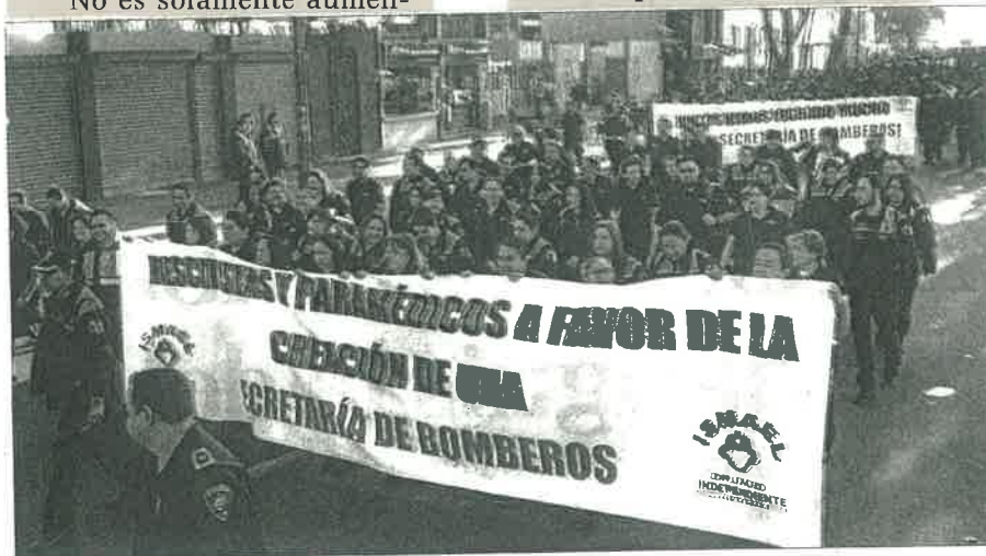
Desde las 8 de la mañana cientos de bomberos apoyaron las propuestas de su líder sindical.

Refirió que la iniciativa para mejorar las condiciones laborales de los policías busca terminar con las "prácticas inhumanas" de los arrestos y las jornadas de hasta 72 horas de trabajo, pues "muchas veces sin que tengan incluso ropa interior".