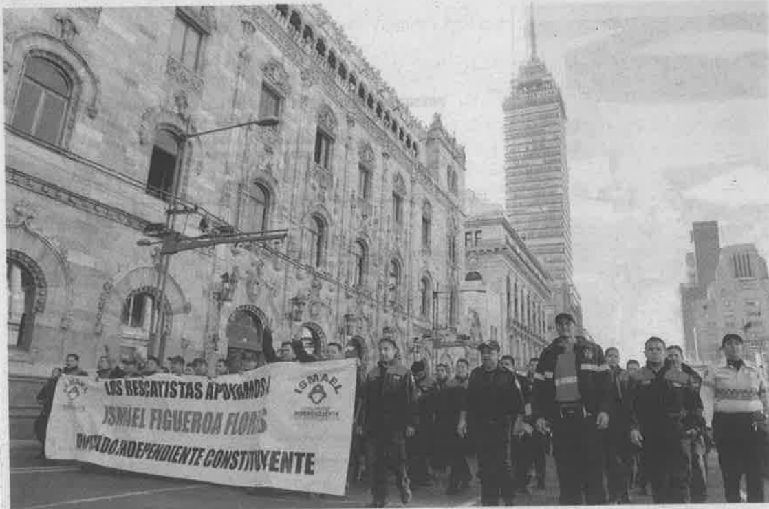
Un grupo de rescatistas marchó en apoyo del diputado independiente constituyente Ismael Figueroa.