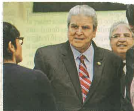
Personaje. Carlos Humberto Aceves del Olmo es secretario general de la CTM.

Al respecto, Alejandro Encinas explicó que ya hay solicitudes de información a la Secretaría de Gobernación y al Instituto Nacional Electoral al respecto, por lo que a ellos les corresponderá la investigación.