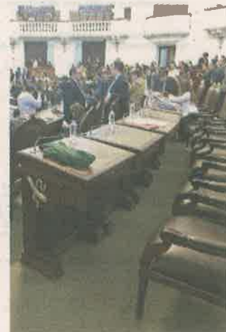
■ Sesión de la ALDF el martes pasado.

Manifestó que el trabajo legislativo fue “sustantivo” y los dos puntos pendientes serán enlistados en la orden del día de hoy.