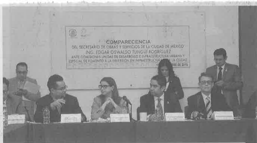
SE ADVIRTIÓ que resultarían afectadas la ampliaciones de las líneas A, 9 y 12 del Metro, así como la construcción de la línea 7 del Metrobús.

Frente a los legisladores, adelantó que próximamente se publicará la licitación para la obra civil del corredor de la Línea 7 del Metrobús, que correrá por Paseo de la Reforma en beneficio de alrededor de 110 mil personas, proyecto que incluye la rehabilitación de Calzada de los Misterios y las glorietas