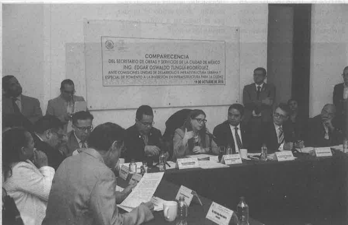
⊕ Durante la comparecencia, el titular de la Sobse fue cuestionado por el tema del tren interurbano.