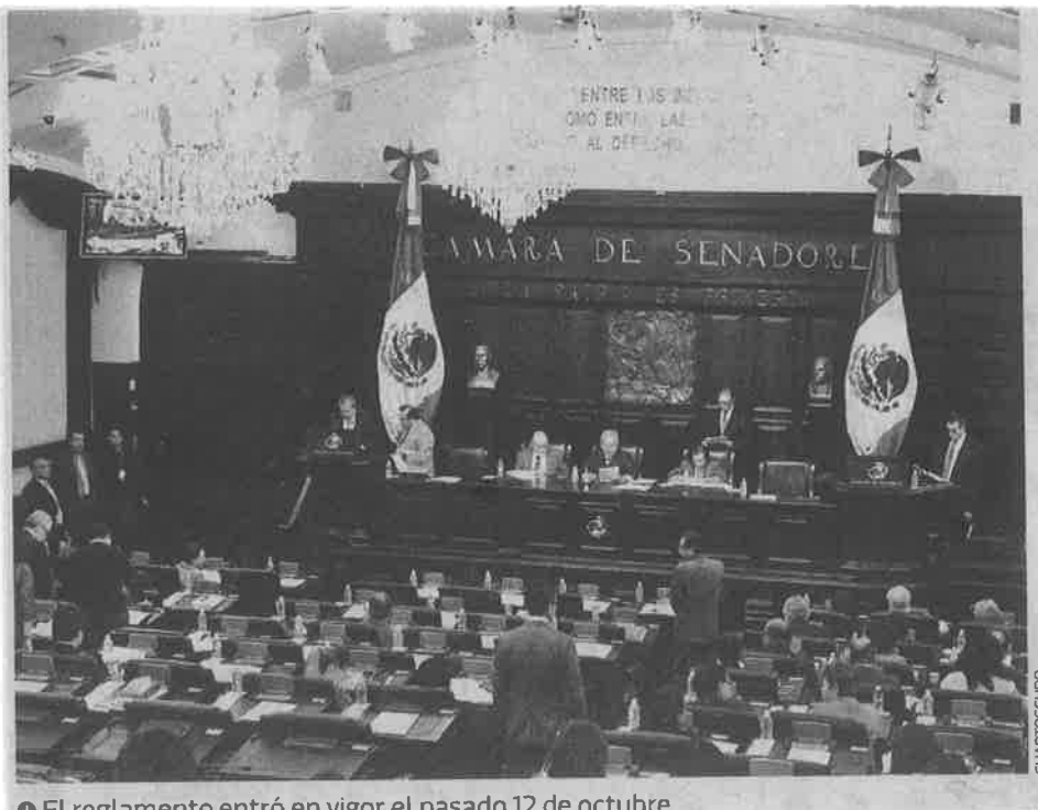
⊕ El reglamento entró en vigor el pasado 12 de octubre.

Consideró que otro de los asuntos que dará mucho de qué hablar será el del sexo-servicio, pero pidió ver el asunto como "un tema laboral".