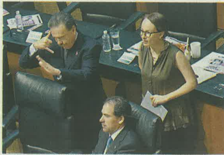
Los legisladores Emilio Gamboa, Pablo Escudero y Gabriela Cuevas.