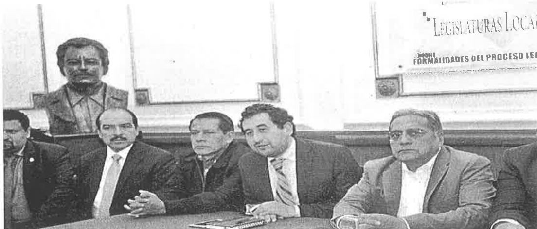
LEGISLADORES DEL PRI, PAN y Morena, confían aprobar el dictamen de la ley de amnistía.