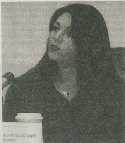
La red de tuberías ha rebasado su vida útil de más de 50 años.

"El gobierno federal parece ser insensible a las necesidades de los habitantes de la entidad que más aporta a la Federación, por eso los diputados deben evitar deteriorar la vida de las personas en la Ciudad de México", al tiempo en que se comprometió a seguir insistiendo en la Cámara Baja para que no se le "arrebate" a los capitalinos los recursos federales que necesitan.