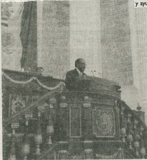
La finalidad crear una cultura de no desperdicio de alimentos y fomentará su donación a la población menos favorecida o vulnerable.

Indicó que en México se desperdician más de 10 millones de toneladas de alimentos al año, que representa el 37 por ciento de la producción agropecuaria en el país, con lo que se podría evitar el hambre que padecen 7 millones de mexicanos en pobreza extrema de alimentación, según cifras de la Secretaría de Desarrollo Social Federal, lo que será contrarrestado con la aplicación de la iniciativa.