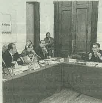
Fallan esfuerzos, acusan

Durante la comparecencia del titular de la Secretaría de Cultura de la Ciudad de Méxi-